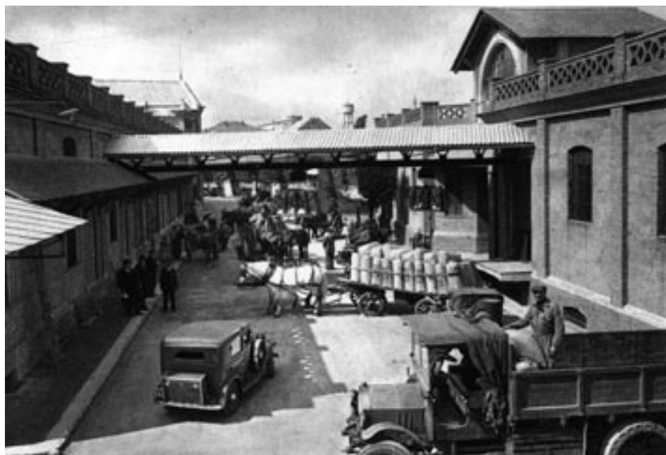
Fig. 1 - I magazzini del Consorzio agrario cooperativo quando erano ancora in attività nel periodo tra le due guerre mondiali (Archivio e Biblioteca del CeDOT-Centro di Documentazione e di Osservazione del Territorio).

Nel disegnare la città futura, nel ragionare sul progetto urbano, la storia del territorio e degli uomini che lo hanno segnato non è un mero accessorio decorativo; è infatti essenziale, a nostro avviso, un'attenzione permanente sul nesso tra memoria e progetto, cioè, in definitiva, tra conoscenza del territorio ed effettiva capacità di