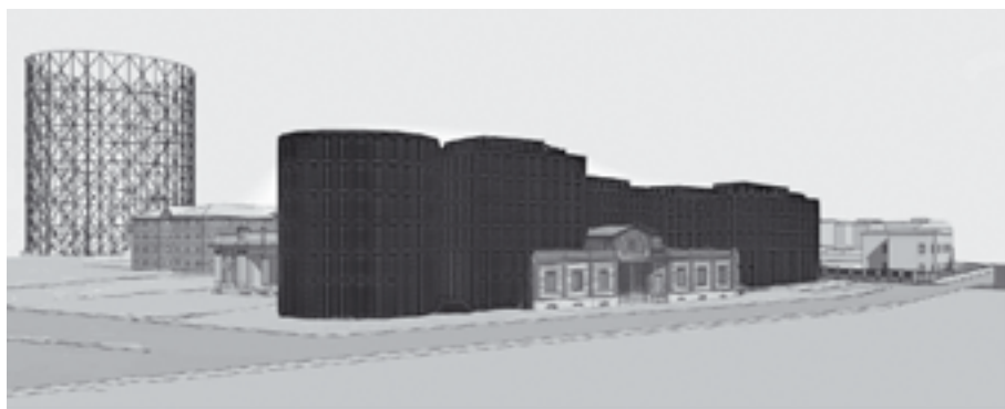
Figg. 3, 4 - Ricostruzione del nuovo scenario dell'area (veduta prospettica e dall'alto dei nuovi edifici indicati in grigio scuro) a seguito dell'applicazione dell'accordo di programma e della distruzione del sito di archeologia industriale del Consorzio (Archivio e Biblioteca del CeDOT-Centro di Documentazione e di Osservazione del Territorio).