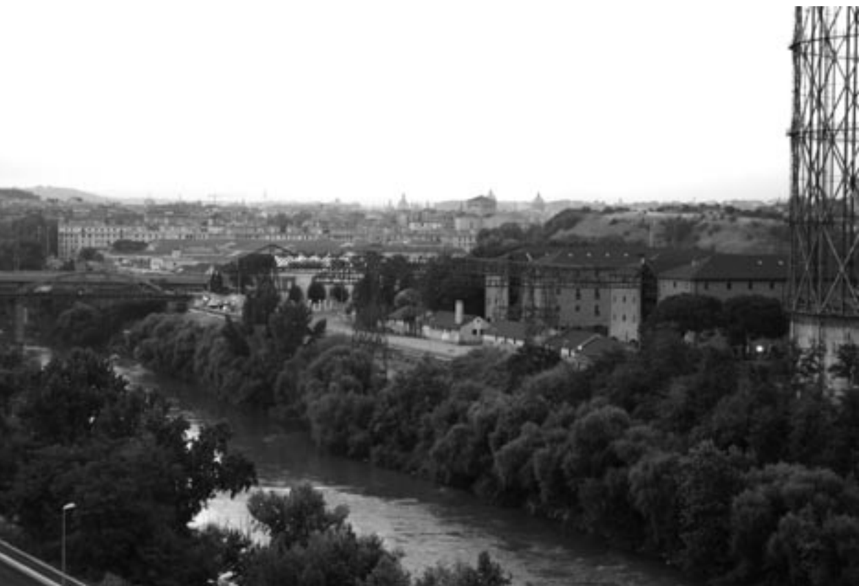
Fig. 5 - Veduta della riva sinistra del Tevere dall'ex-Mattatoio al Gazometro, 2006.

Per aderire all'appello: cedot@uniroma3.it - croma@uniroma3.it tel. 06.57374235 - fax 06.57374030