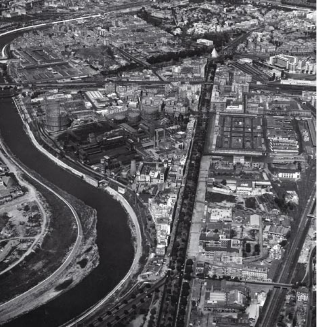
Fig. 2 - Veduta prospettica della zona Ostiense, 1961, volo Fotocielo, ICCD-Aerofototeca.